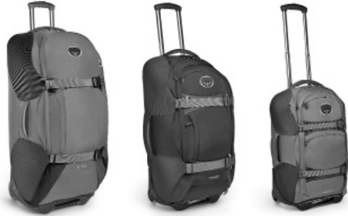
Shuttle 32"/110L Shuttle 28"/80L Shuttle 22"/40L