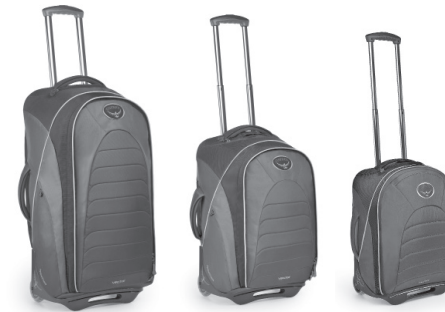
向量 28 英吋/75 升 向量 22 英吋/46 升 向量 18 英吋/30 升