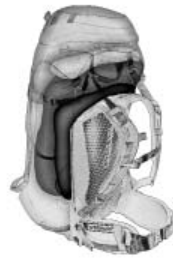
Heavy ————— Light

배낭을 잘 꾸리면, 배낭을 매고있는 동안 편안함을 극대화할 수 있습니다. 보다 자세한 정보는 www.ospreypacks.com/PackTech/HowToPackYourPack 에서 조회할 수 있습니다